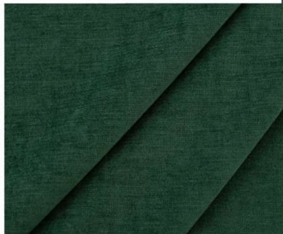
LUXURY - 1275 СИЯЮЩИЙ ИЗУМРУД