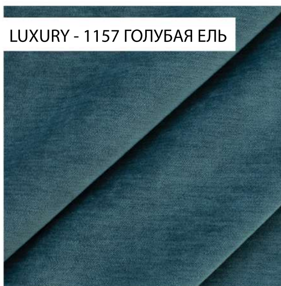
LUXURY - 1157 ГОЛУБАЯ ЕЛЬ