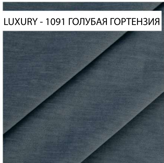
LUXURY - 1091 ГОЛУБАЯ ГОРТЕНЗИЯ