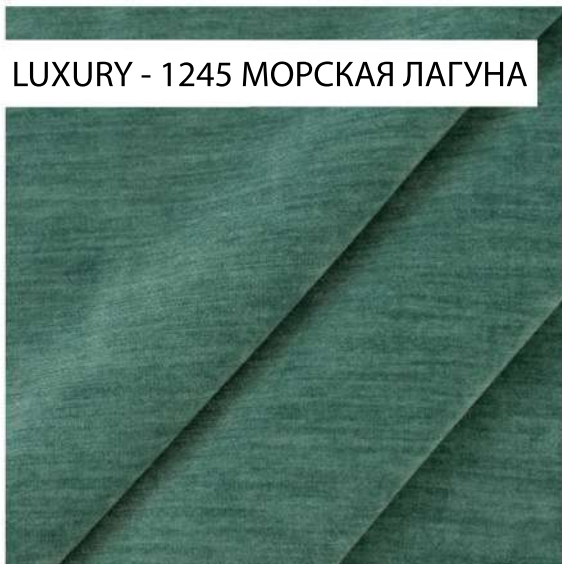
LUXURY - 1245 МОРСКАЯ ЛАГУНА