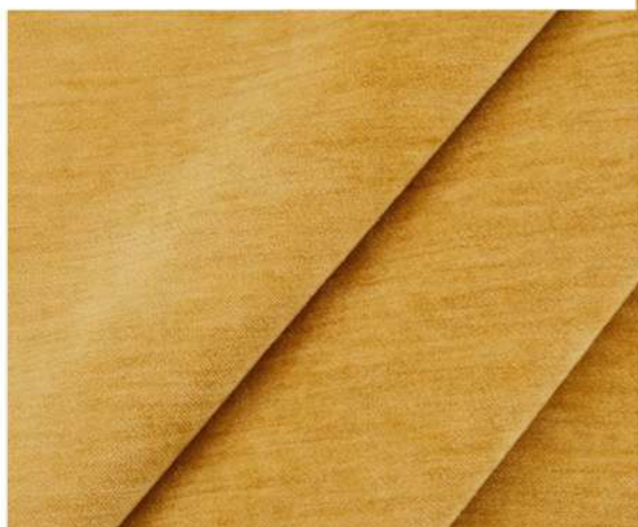
LUXURY - 1211 СОЛНЕЧНЫЙ ЯНТАРЬ