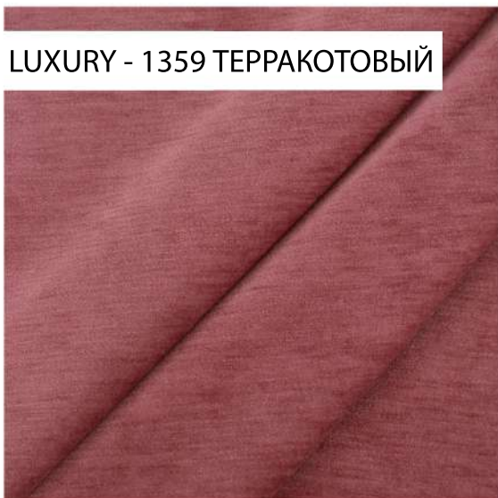
LUXURY - 1359 ТЕРРАКОТОВЫЙ