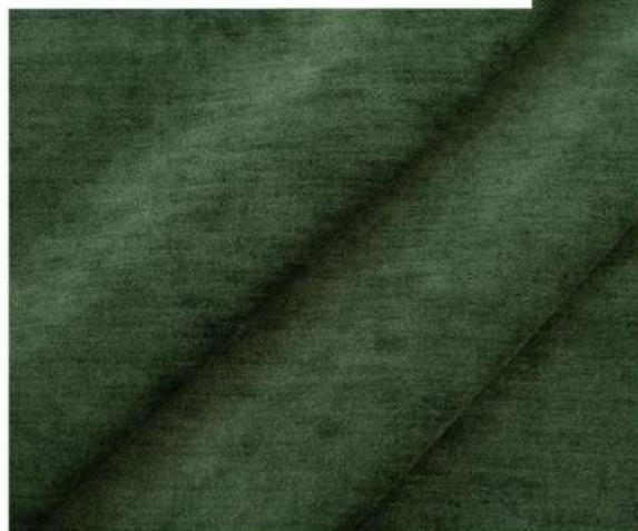
LUXURY - 1312 АРОМАТ ХВОИ