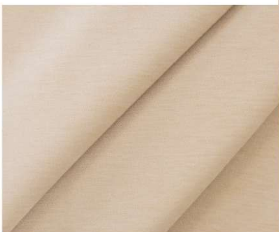
LUXURY - 1105 ВАНИЛЬНЫЙ КОКТЕЙЛЬ