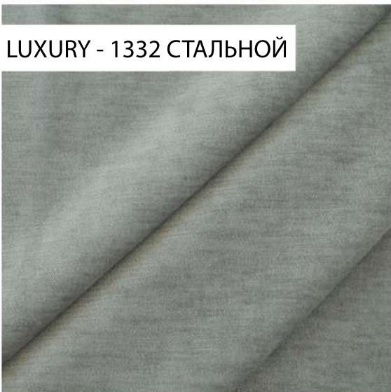
LUXURY - 1332 СТАЛЬНОЙ