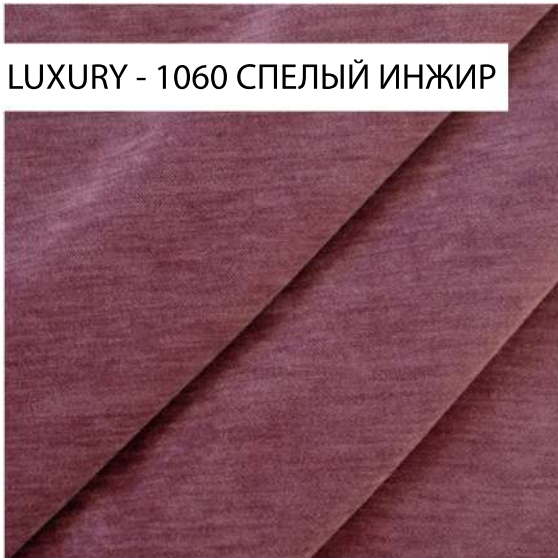
LUXURY - 1060 СПЕЛЫЙ ИНЖИР