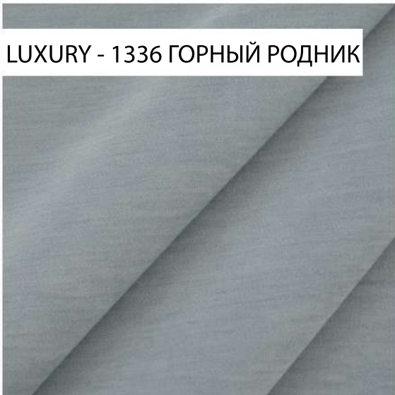
LUXURY - 1336 ГОРНЫЙ РОДНИК