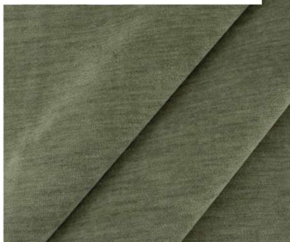
LUXURY - 1357 СПЕЛАЯ ОЛИВКА