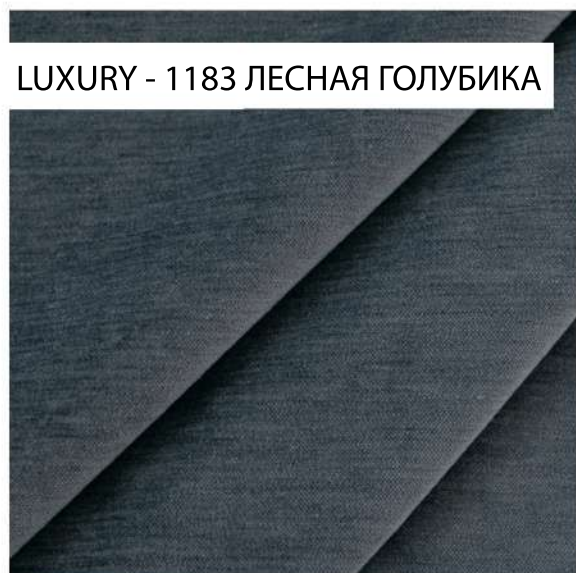
LUXURY - 1183 ЛЕСНАЯ ГОЛУБИКА