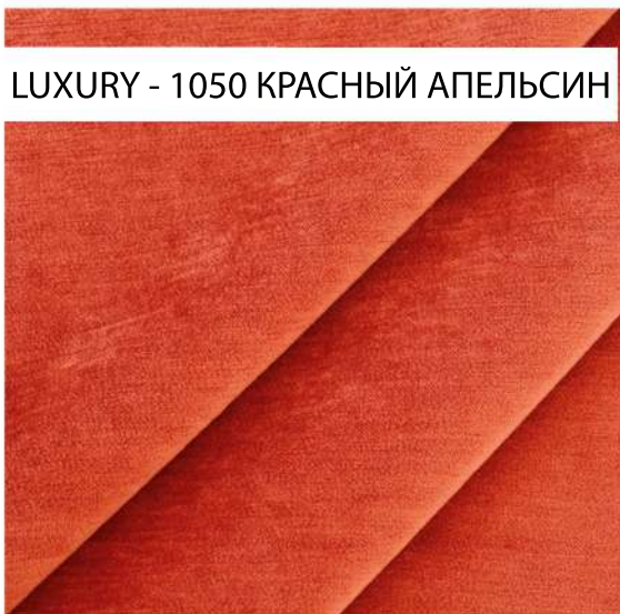
LUXURY - 1050 КРАСНЫЙ АПЕЛЬСИН