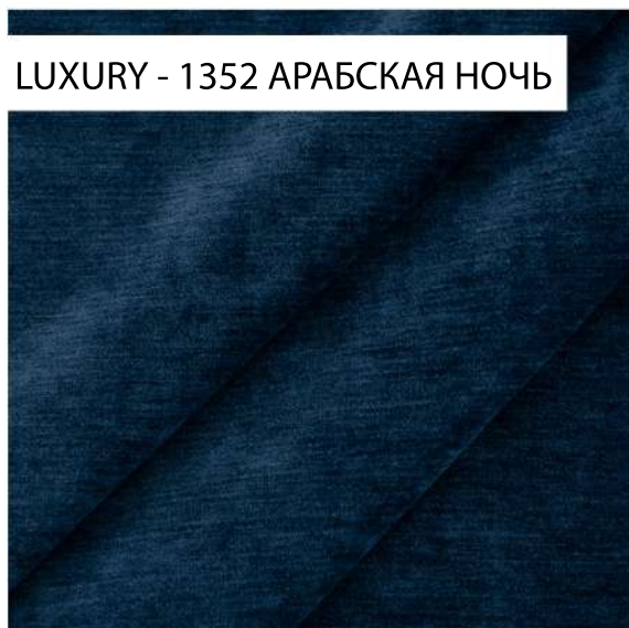
LUXURY - 1352 АРАБСКАЯ НОЧЬ