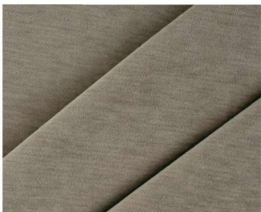
LUXURY - 1223 ЖАРЕННЫЙ КУНЖУТ