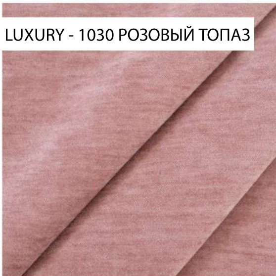
LUXURY - 1030 РОЗОВЫЙ ТОПАЗ