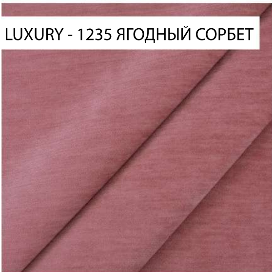
LUXURY - 1235 ЯГОДНЫЙ СОРБЕТ