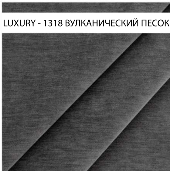
LUXURY - 1318 ВУЛКАНИЧЕСКИЙ ПЕСОК