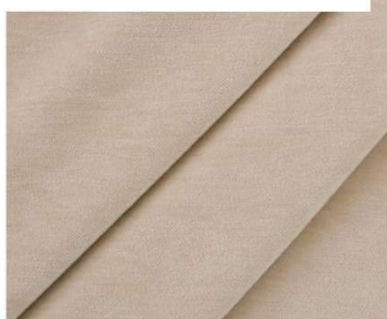
LUXURY - 1124 ЛАТТЕ С ПЕНКОЙ