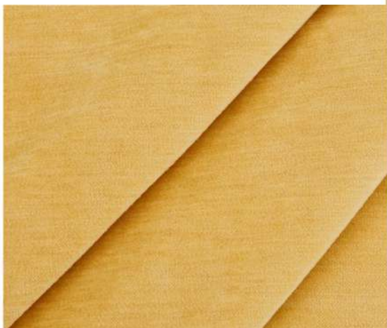
LUXURY - 1237 ВЕСЕННЯЯ МИМОЗА