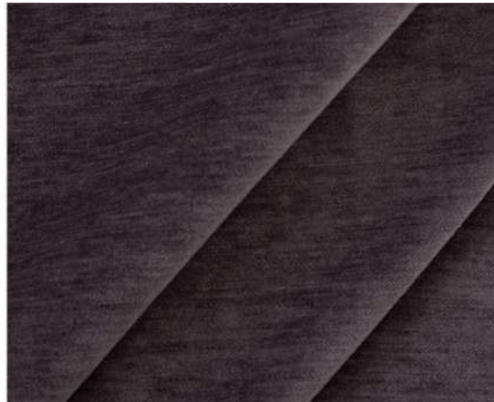
LUXURY - 1289 ГОРЯЧИЙ КАПУЧИНО