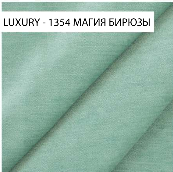
LUXURY - 1354 МАГИЯ БИРЮЗЫ