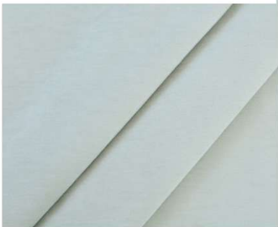
LUXURY - 1181 ЛУННАЯ ДОРОЖКА